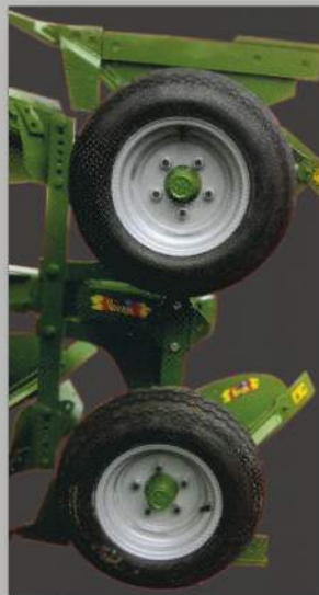
Coppia ruote profondità. (a richiesta)