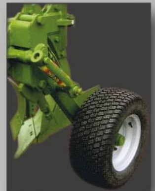
Ruota regolazione profondità in gomma con dispositivo oscillante. (a richiesta)