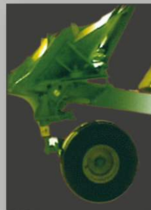
Ruota combinata trasporto e lavoro. (a richiesta)