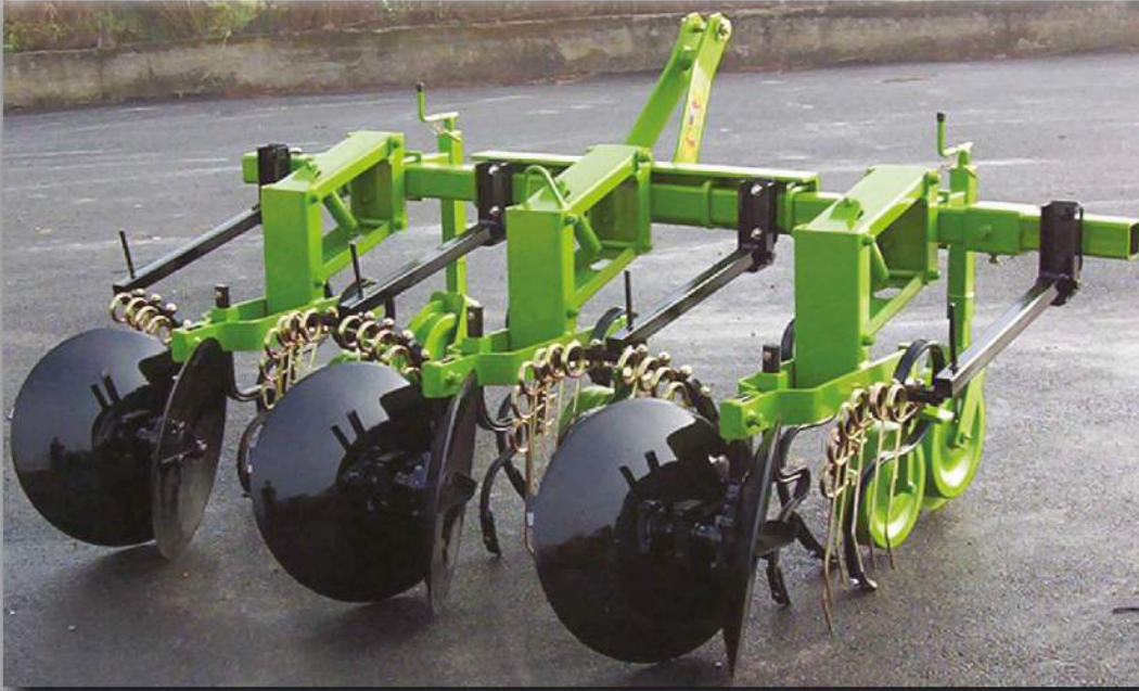
SARCHIATRICE PER PATATE CON VOMERI E RINCALZATORI (modulare)

Elementi costituiti da dischi rincalzatori, tre molle vibro e ruota in ferro