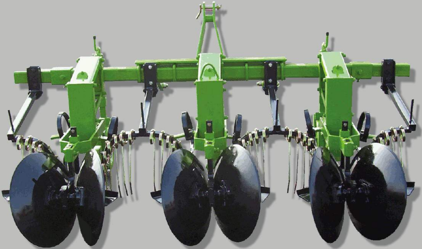
Sarchiatrice per patate